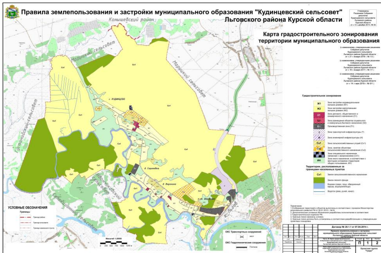
Рис.1. Схема градостроительного зонирования территории муниципального образования «Кудинцевский сельсовет» Льговского района Курской области